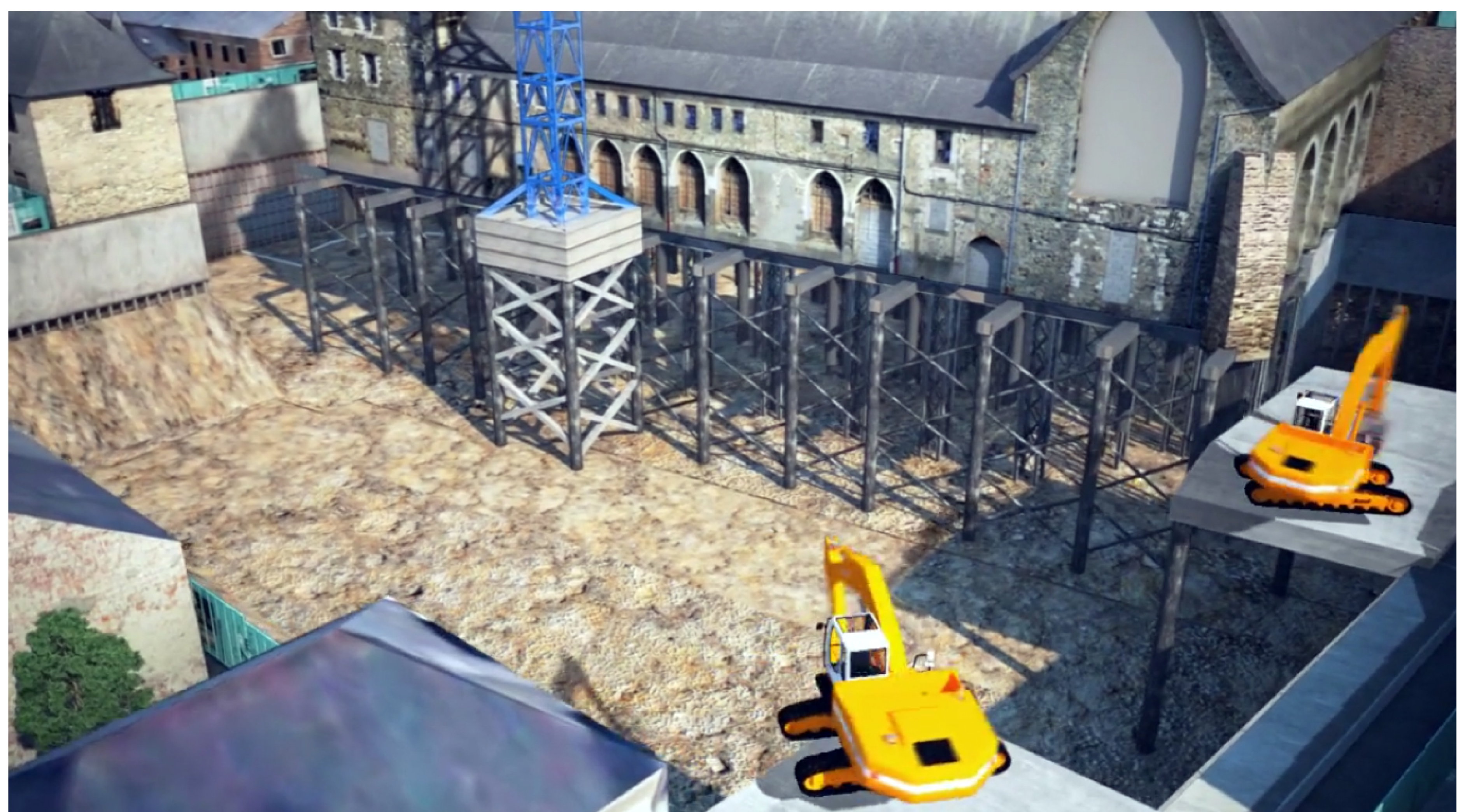
Aménagement urbain & sauvegarde du patrimoine (Couvent des Jacobins, Rennes)*