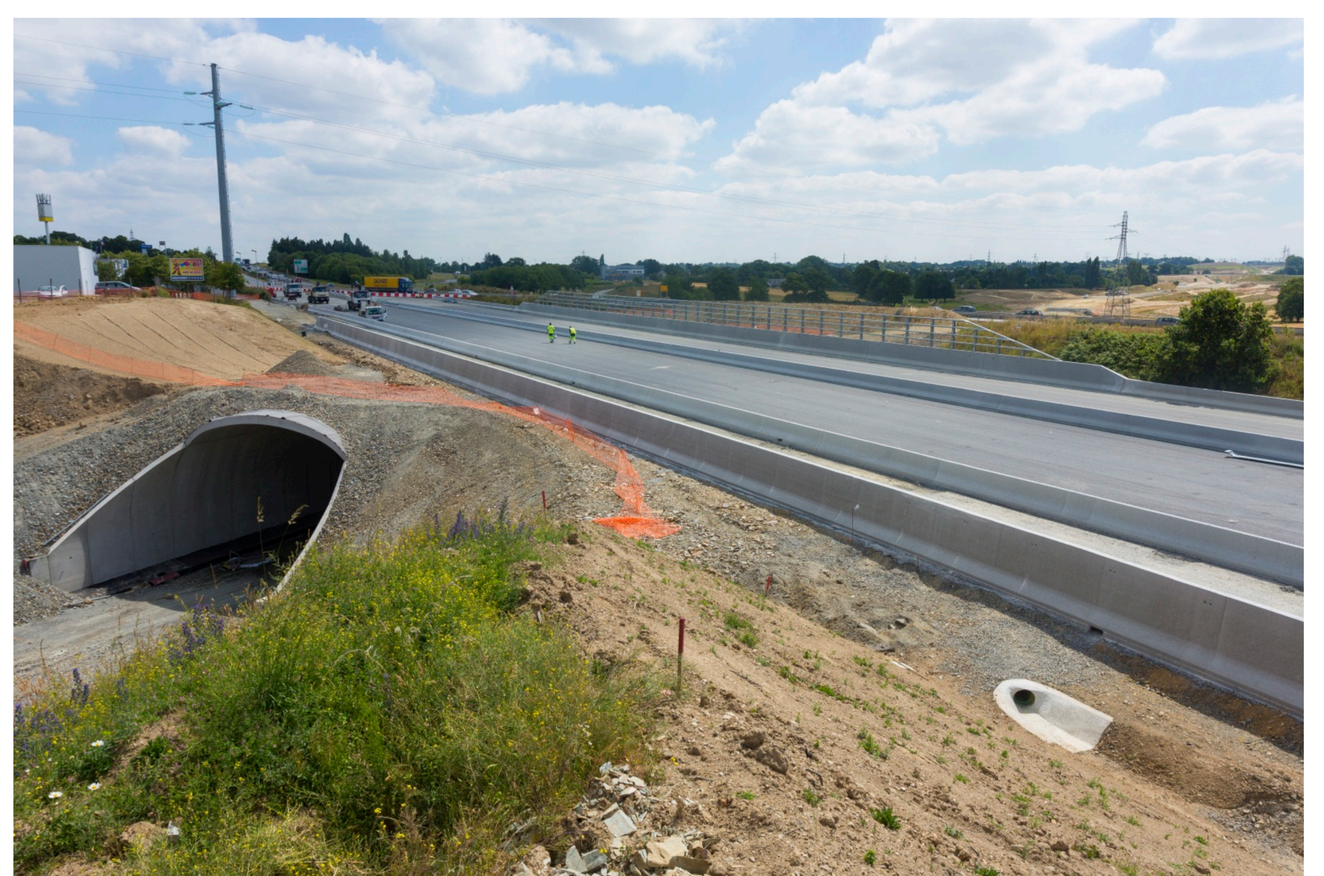
Equipements de transports (LGV ouest)*