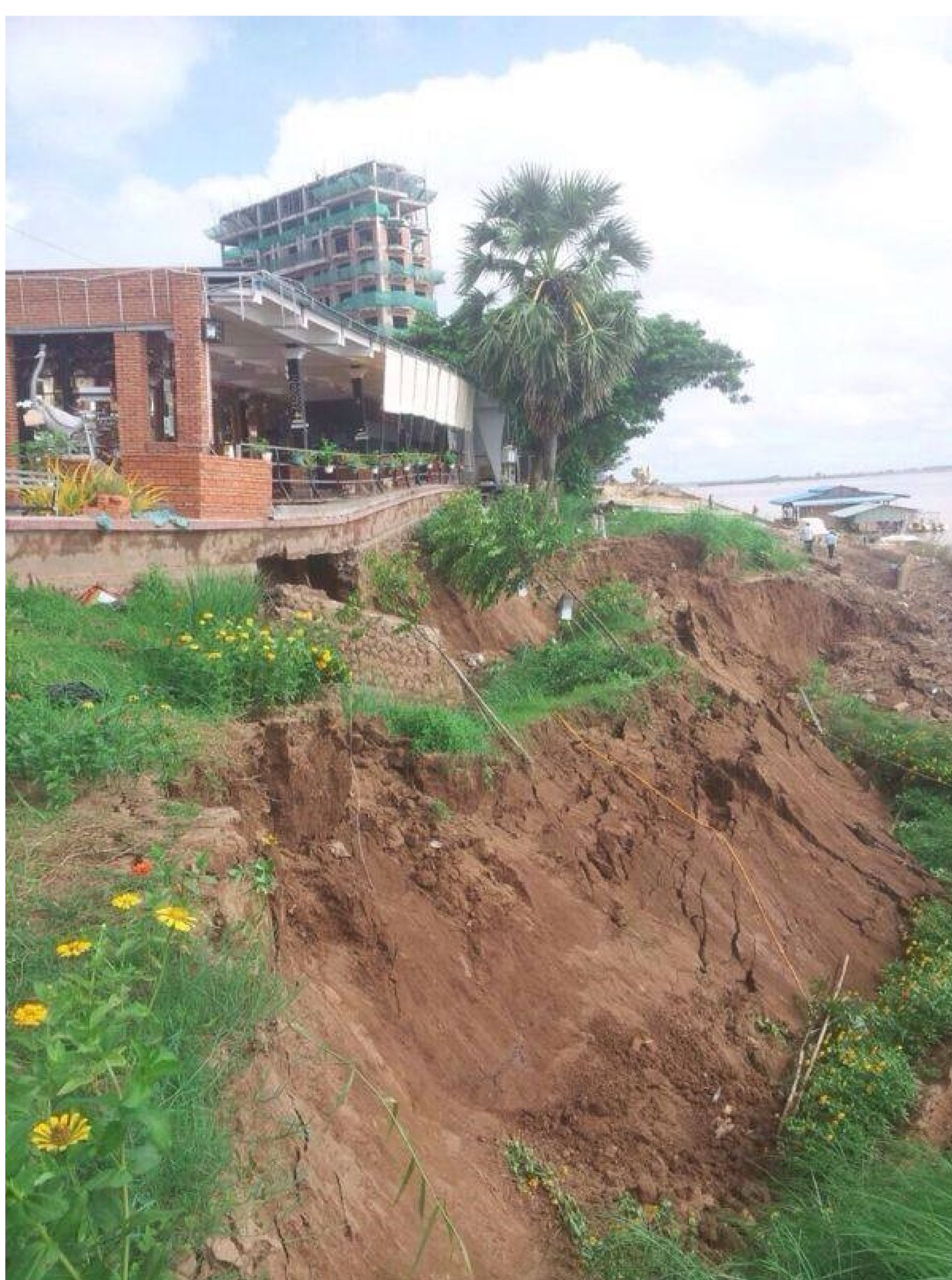
Protection des risques naturels (glissement de terrains)